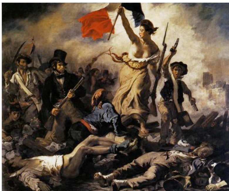
Eugène Delacroix, La Liberté che guida il popolo (1830), Museo del Louvre

Lo stesso può dirsi per quanto capitato con la Rivoluzione francese, con tanti mistici laici tra cui spicca la figura di Maximilien Robespierre, l' Incorruttibile . La componente distruttiva di questa mistica esplose in una vera e propria carneficina in nome di una fede nuova, la fede nella Libertà , che viene effigiata da Delacroix nel famoso quadro qui riprodotto.